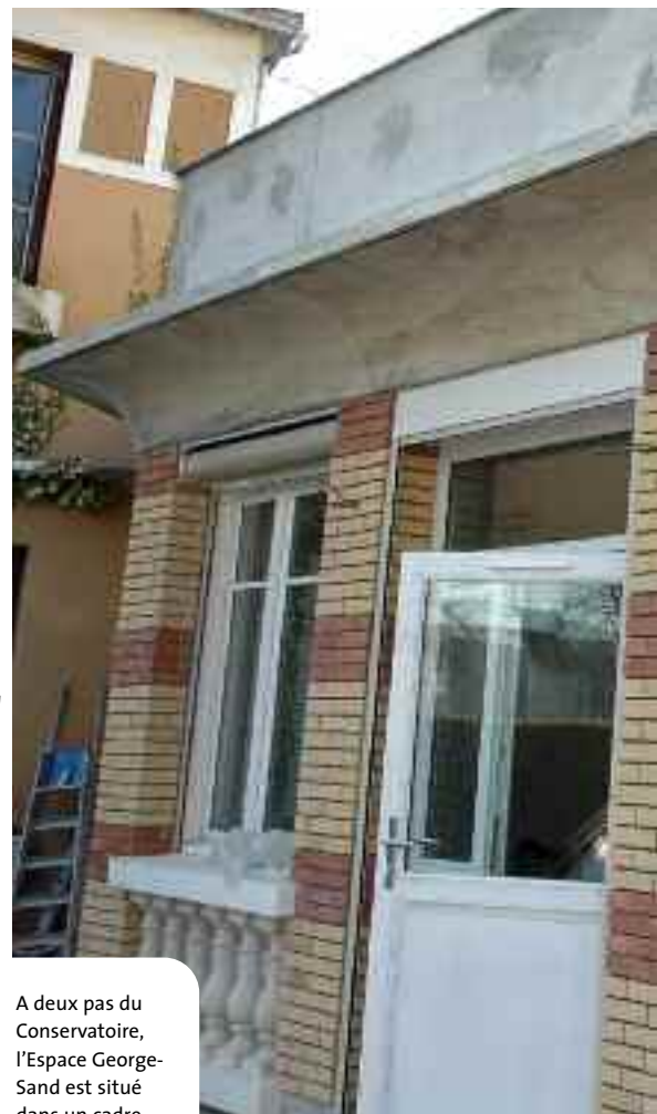
A deux pas du Conservatoire, l'Espace George-Sand est situé dans un cadre privilégié.

Le prochain Forum des retraités aura lieu le vendredi 26 mars , à 15 h, à l'Espace Senior.