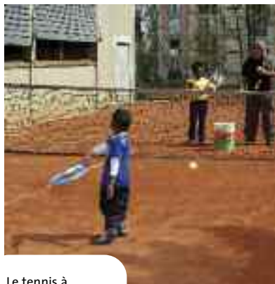
Le tennis à Pierrefitte : c'est apprendre et jouer dans un cadre agréable.

Les temps changent et avec eux la section Tennis de l'ASP, reflet aujourd'hui d'une époque et de ses pratiques.