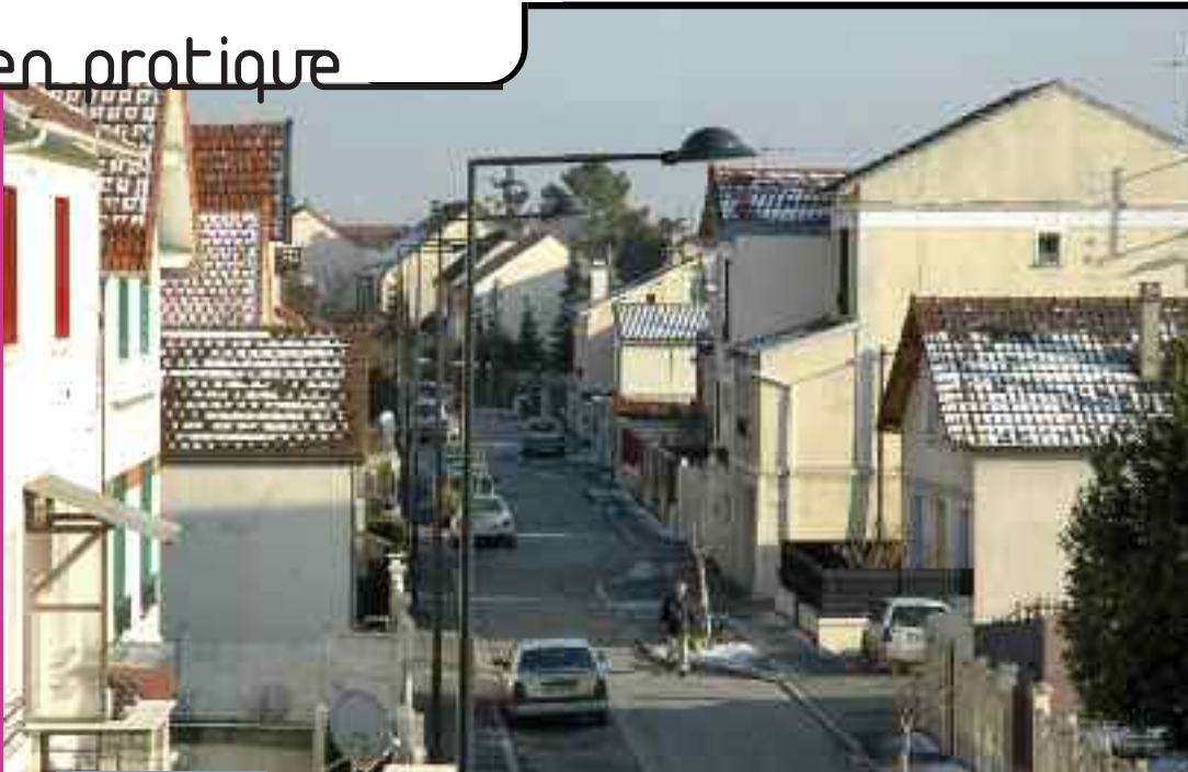
HISTOIRE DE LA VILLE