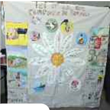
L'association met en place de multiples projets à destination des femmes.

Depuis 1994, l'association « Femmes pierrefittoises » organise des moments de rencontre et de partage entre les habitantes de la ville.