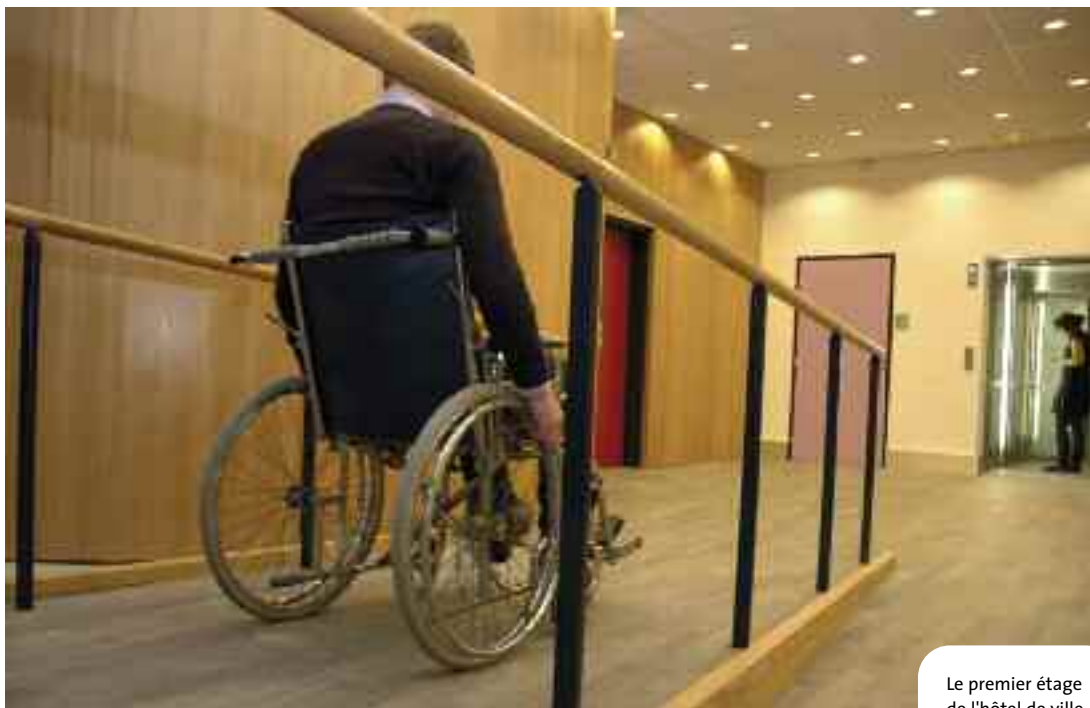
Le premier étage de l'hôtel de ville a lui aussi été aménagé

« Avec l'ancien accueil, il nous arrivait, à mes collègues et à moi, d'aider certaines personnes – le plus souvent des personnes âgées – à gravir les escaliers du parvis. Avec ces nouveaux équipements, les accès devraient être plus simples. »