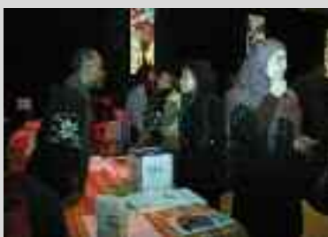
Les membres du Conseil municipal des collégiens ont récolté des pâtes et du riz pour Haïti.