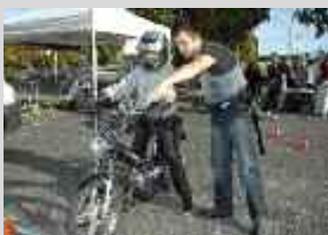
Lors de la journée prévention et citoyenneté, les enfants et adolescents ont pu profiter de nombreuses activités