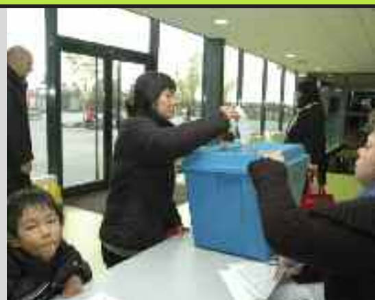
Le 16 octobre, les parents d'élèves ont procédé à l'élection de leurs représentants.