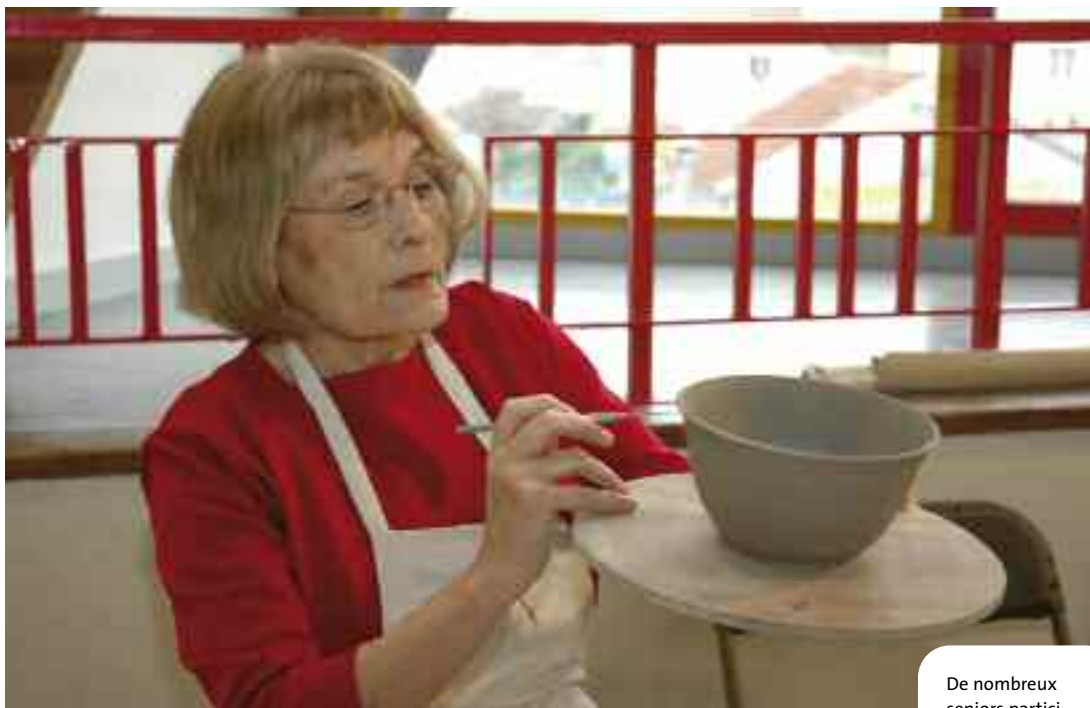
De nombreux seniors participent aux activités proposées sur le territoire communal.

« Nous proposons plusieurs disciplines à nos adhérents: gym aquatique, natation, tennis de table, badminton, gymnastique et randonnée. Il ne s'agit pas de faire de la compétition, mais surtout d'entretenir sa forme, dans une bonne ambiance. »